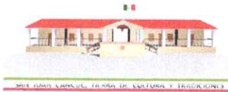
TABLA DE APLICABILIDAD, ACTUALIZACIÓN Y CONSERVACIÓN DE LA INFORMACIÓN

H. AYUNTAMIENTO MUNICIPAL CONSTITUCIONAL DE SAN JUAN CANCUC, CHIAPAS. 2021-2024.