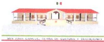
TABLA DE APLICABILIDAD, ACTUALIZACIÓN Y CONSERVACIÓN DE LA INFORMACIÓN H. AYUNTAMIENTO MUNICIPAL CONSTITUCIONAL DE SAN JUAN CANCUC, CHIAPAS. 2021-2024.