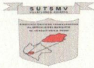
TABLA DE APLICABILIDAD, ACTUALIZACIÓN Y CONSERVACIÓN DE LA INFORMACIÓN SINDICATO UNICO DE TRABAJADORES AL SERVICIO DEL MUNICIPIO DE VILLAFLORES, CHIAPAS.