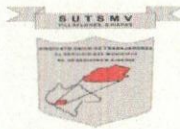
TABLA DE APLICABILIDAD, ACTUALIZACIÓN Y CONSERVACIÓN DE LA INFORMACIÓN SINDICATO ÚNICO DE TRABAJADORES AL SERVICIO DEL MUNICIPIO DE VILLAFLORES, CHIAPAS