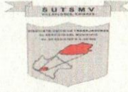
TABLA DE APLICABILIDAD, ACTUALIZACIÓN Y CONSERVACIÓN DE LA INFORMACIÓN SINDICATO ÚNICO DE TRABAJADORES AL SERVICIO DEL MUNICIPIO DE VILFLORES, CHIAPAS