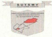
TABLA DE APLICABILIDAD, ACTUALIZACIÓN Y CONSERVACIÓN DE LA INFORMACIÓN SINDICATO ÚNICO DE TRABAJADORES AL SERVICIO DEL MUNICIPIO DE VILLAFLORES, CHIAPAS