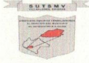
TABLA DE APLICABILIDAD, ACTUALIZACIÓN Y CONSERVACIÓN DE LA INFORMACIÓN SINDICATO ÚNICO DE TRABAJADORES AL SERVICIO DEL MUNICIPIO DE VILLAFLORES, CHIAPAS