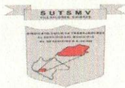
TABLA DE APLICABILIDAD, ACTUALIZACIÓN Y CONSERVACIÓN DE LA INFORMACIÓN SINDICATO ÚNICO DE TRABAJADORES AL SERVICIO DEL MUNICIPIO DE VILLAFLORES, CHIAPAS