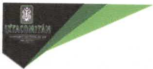
TABLA DE APLICABILIDAD, ACTUALIZACIÓN Y CONSERVACIÓN DE LA INFORMACIÓN H. AYUNTAMIENTO DE IXTACOMITÁN, CHIAPAS