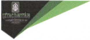
TABLA DE APLICABILIDAD, ACTUALIZACIÓN Y CONSERVACIÓN DE LA INFORMACIÓN H. AYUNTAMIENTO DE IXTACOMITAN, CHIAPAS