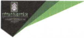
TABLA DE APLICABILIDAD, ACTUALIZACIÓN Y CONSERVACIÓN DE LA INFORMACIÓN H.AYUNTAMIENTO DE IXTACOMITAN, CHIAPAS