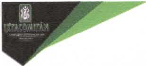
TABLA DE APLICABILIDAD, ACTUALIZACIÓN Y CONSERVACIÓN DE LA INFORMACIÓN H. AYUNTAMIENTO DE IXTACOMITÁN, CHIAPAS