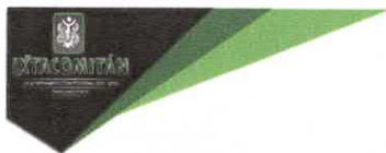
TABLA DE APLICABILIDAD, ACTUALIZACIÓN Y CONSERVACIÓN DE LA INFORMACIÓN H. AYUNTAMIENTO DE IXTACOMITÁN, CHIAPAS