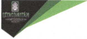
TABLA DE APLICABILIDAD, ACTUALIZACIÓN Y CONSERVACIÓN DE LA INFORMACIÓN H. AYUNTAMIENTO DE IXTACOMITAN, CHIAPAS