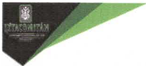
TABLA DE APLICABILIDAD, ACTUALIZACIÓN Y CONSERVACIÓN DE LA INFORMACIÓN H. AYUNTAMIENTO DE IXTACOMITÁN, CHIAPAS