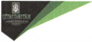
TABLA DE APLICABILIDAD, ACTUALIZACIÓN Y CONSERVACIÓN DE LA INFORMACIÓN H. AYUNTAMIENTO DE IXTACOMITAN, CHIAPAS