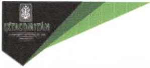
TABLA DE APLICABILIDAD, ACTUALIZACIÓN Y CONSERVACIÓN DE LA INFORMACIÓN H. AYUNTAMIENTO DE IXTACOMITAN, CHIAPAS