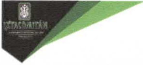
TABLA DE APLICABILIDAD, ACTUALIZACIÓN Y CONSERVACIÓN DE LA INFORMACIÓN H.AYUNTAMIENTO DE IXTACOMITÁN, CHIAPAS