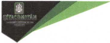
TABLA DE APLICABILIDAD, ACTUALIZACIÓN Y CONSERVACIÓN DE LA INFORMACIÓN H. AYUNTAMIENTO DE IXTACOMITÁN, CHIAPAS