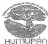
TABLA DE APLICABILIDAD, ACTUALIZACIÓN Y CONSERVACIÓN DE LA INFORMACIÓN H. AYUNTAMIENTO DE HUITIUPÁN, CHIAPAS.