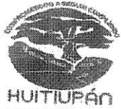
TABLA DE APLICABILIDAD, ACTUALIZACIÓN Y CONSERVACIÓN DE LA INFORMACIÓN H. AYUNTAMIENTO DE HUITIUPÁN, CHIAPAS.