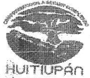
TABLA DE APLICABILIDAD, ACTUALIZACIÓN Y CONSERVACIÓN DE LA INFORMACIÓN H. AYUNTAMIENTO DE HUITIUPÁN, CHIAPAS.