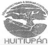
TABLA DE APLICABILIDAD, ACTUALIZACIÓN Y CONSERVACIÓN DE LA INFORMACIÓN H. AYUNTAMIENTO DE HUITIUPÁN, CHIAPAS.