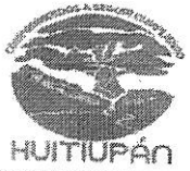
TABLA DE APLICABILIDAD, ACTUALIZACIÓN Y CONSERVACIÓN DE LA INFORMACIÓN H. AYUNTAMIENTO DE HUITUPÁN, CHIAPAS.