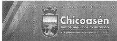
TABLA DE APLICABILIDAD, ACTUALIZACIÓN Y CONSERVACIÓN DE LA INFORMACIÓN H. Ayuntamiento de Chicoasén 2021-2024