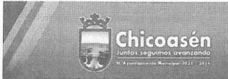
TABLA DE APLICABILIDAD, ACTUALIZACIÓN Y CONSERVACIÓN DE LA INFORMACIÓN H. Ayuntamiento de Chicoasén 2021-2024