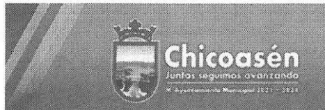
TABLA DE APLICABILIDAD, ACTUALIZACIÓN Y CONSERVACIÓN DE LA INFORMACIÓN H. Ayuntamiento de Chicoasén 2021-2024