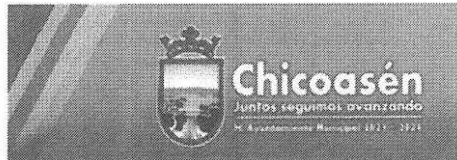
TABLA DE APLICABILIDAD, ACTUALIZACIÓN Y CONSERVACIÓN DE LA INFORMACIÓN H. Ayuntamiento de Chicoasén 2021-2024