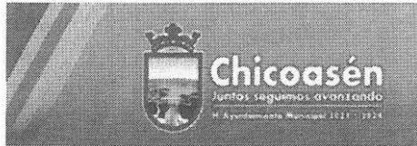
TABLA DE APLICABILIDAD, ACTUALIZACIÓN Y CONSERVACIÓN DE LA INFORMACIÓN H. Ayuntamiento de Chicoasén 2021-2024