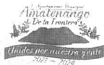
TABLA DE APLICABILIDAD, ACTUALIZACIÓN Y CONSERVACIÓN DE LA INFORMACIÓN