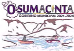
TABLA DE APLICABILIDAD

Sujeto Obligado: H. Ayuntamiento de Osumacinta, Chiapas.