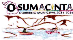
TABLA DE APLICABILIDAD Sujeto Obligado: H. Ayuntamiento de Osumacinta, Chiapas.