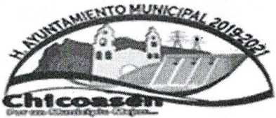
TABLA DE APLICABILIDAD H. AYUNTAMIENTO CONSTITUCIONAL DE CHICOASEN 2019-2021