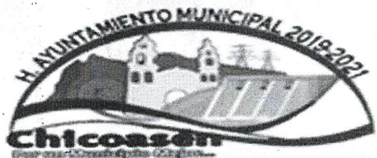
TABLA DE APLICABILIDAD