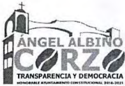
TABLA DE APLICABILIDAD H.AYUNTAMIENTO DE ANGEL ALBINO CORZO