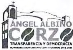
TABLA DE APLICABILIDAD H.AYUNTAMIENTO DE ANGEL ALBINO CORZO