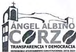
TABLA DE APLICABILIDAD H.AYUNTAMIENTO DE ANGEL ALBINO CORZO