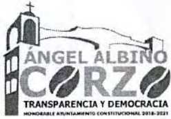
TABLA DE APLICABILIDAD H.AYUNTAMIENTO DE ANGEL ALBINO CORZO