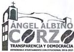
TABLA DE APLICABILIDAD H.AYUNTAMIENTO DE ANGEL ALBINO CORZO