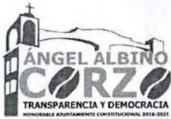
TABLA DE APLICABILIDAD H.AYUNTAMIENTO DE ANGEL ALBINO CORZO