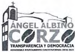
TABLA DE APLICABILIDAD H.AYUNTAMIENTO DE ANGEL ALBINO CORZO