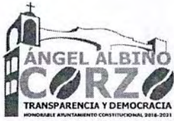
TABLA DE APLICABILIDAD H.AYUNTAMIENTO DE ANGEL ALBINO CORZO