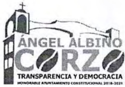
TABLA DE APLICABILIDAD H.AYUNTAMIENTO DE ANGEL ALBINO CORZO