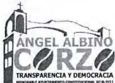
TABLA DE APLICABILIDAD H. AYUNTAMIENTO DE ANGEL ALBINO CORZO