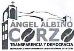
TABLA DE APLICABILIDAD H.AYUNTAMIENTO DE ANGEL ALBINO CORZO