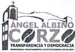
TABLA DE APLICABILIDAD H.AYUNTAMIENTO DE ANGEL ALBINO CORZO